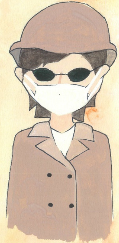
かんせんよぼう 感染予防 かふんしょうたいさく 花粉症対策