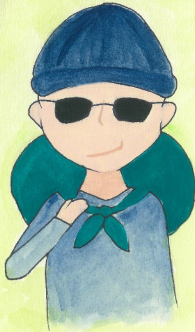
むかしふう 昔風の どろぼう 泥棒