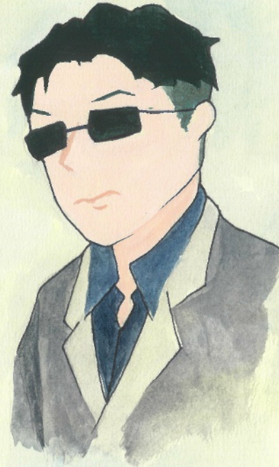
ファッションで 身に付けている